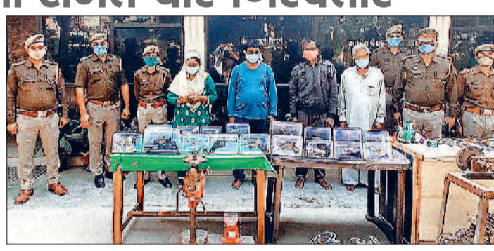
मौके पर मिली नगदी