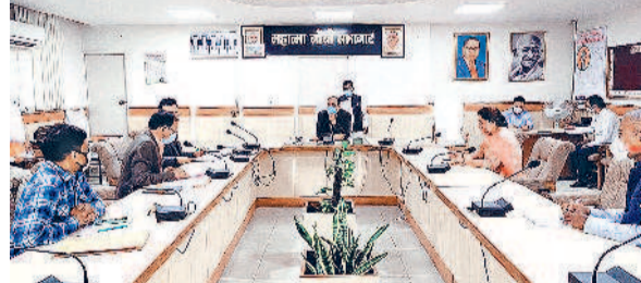
शुल्क नियामक समिति की की बैठक लेते डीएम